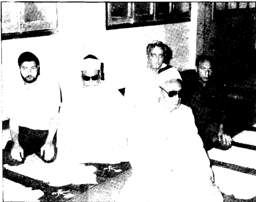
Когда группа молится с имамом, она находится в рядах за ним.