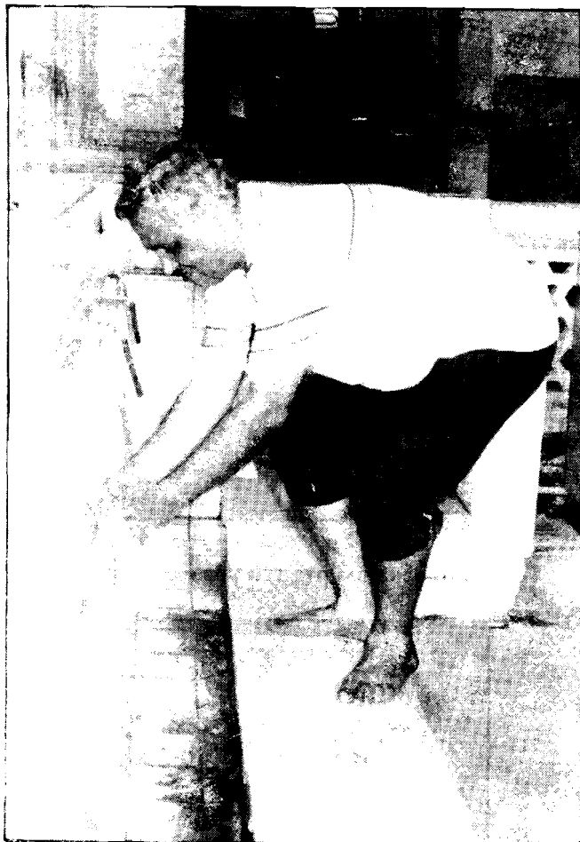
1. Мытье рук.