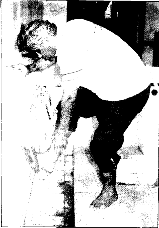
9. Мытье правой ноги до щиколотки.